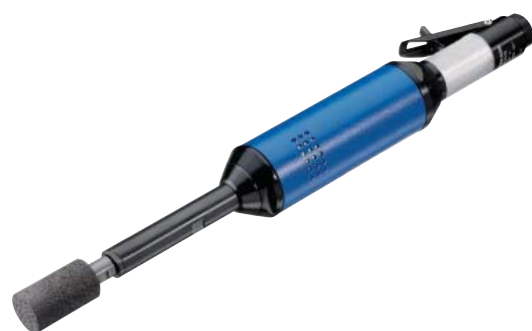
G 100 H