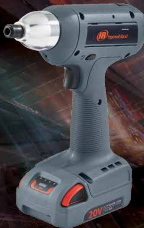
Visseuse de précision Série QX