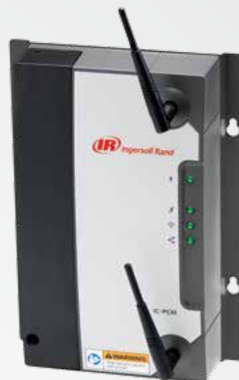
IC-PCM-2-EU IC-PCM-2-EU CPN 24119638