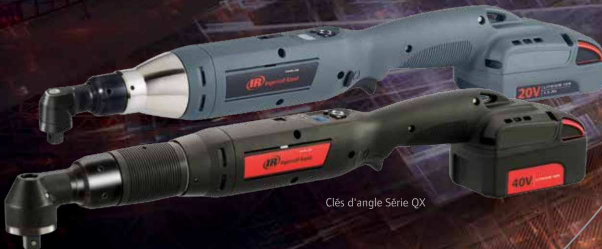
Clés d'angle Série QX